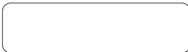
Obrázok 1 Názov obrázku (11 pt, kurzíva) Zdroj:

Text ..... (Times New Roman, 12 pt, medzery medzi odsekmi 6 bodov, riadkovanie 1,5).