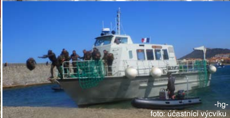
-hg- foto: účastníci výcviku