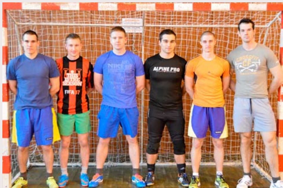
Malý futbal - 1. miesto