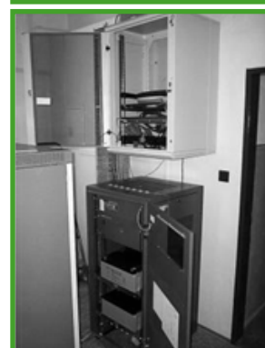
Laboratórium s ústredňou Tesla UE 300 (hore) a UE 60 s prepojovacím poľom (dole)