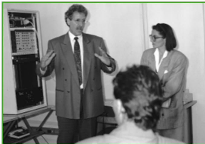
Ukážka technológie základňovej stanice hromadných rádiových sietí firmy Motorola na konferencii

Perspektívy rozvoja stálej vojenskej spojovacej siete (1991), Kompatibilita stálej vojenskej spojovacej sústavy (1991), Hromadné rádiové siete a podpora C2 (1992), Technológie Alcatel (1992), Prezentácia technológií Motorola na medzinárodnej výstave IDEB Brno (1992), Bezpečnosť práce na elektrických zariadeniach (1992).