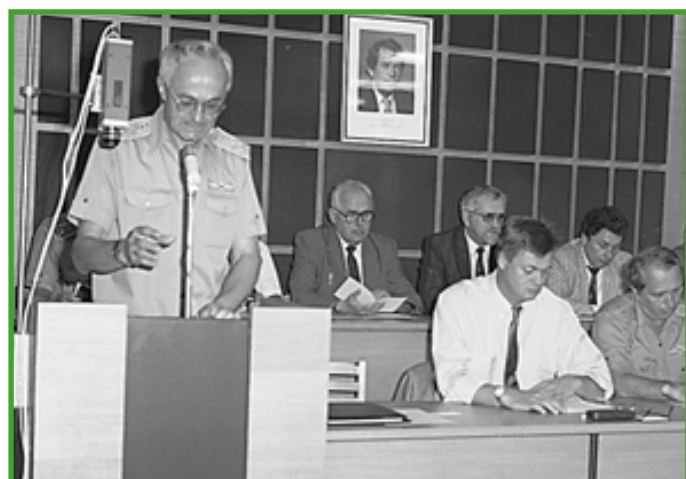
Úvodné slovo dekana Fakulty telekomunikácií na konferencii: Perspektívy rozvoja stálej vojenskej spojovacej siete

Spracoval: doc. Ing. Martin Marko, CSc.