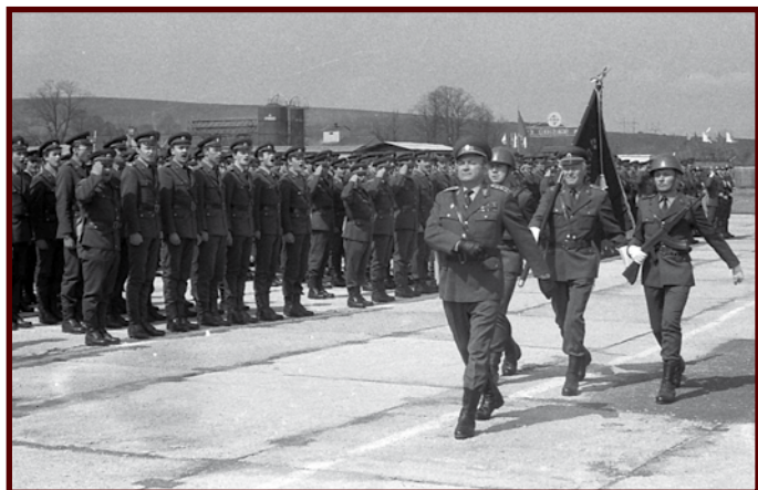
V roku 1981 bola rozkazom prezidenta republiky č. 026/1981 prepožičaná škole bojová zástava, pôvodnú bojovú zástavu Technického učilišťa „zdedilo“ Vojenské učilište.