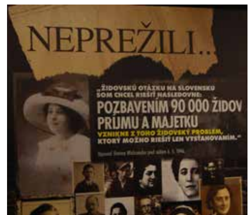
text: -sz