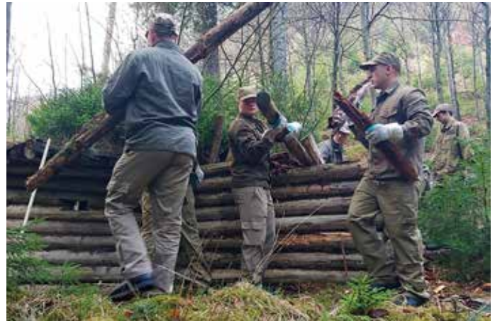
text: -sz-

V ďalšej fáze sa vybuduje nový partizánsky bunker. Sme veľmi radi, že naši kadeti mali možnosť zúčastniť sa a pomôcť pri oprave tejto stavby, ktorá nám pripomína boj Slovákov v SNP počas II. sv. vojny.