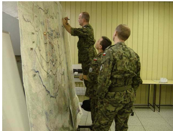
Na fotografii príslušníci MNB Topoľčany na cvičení HAWK 2004 v Centre simulačných technológií NAO.