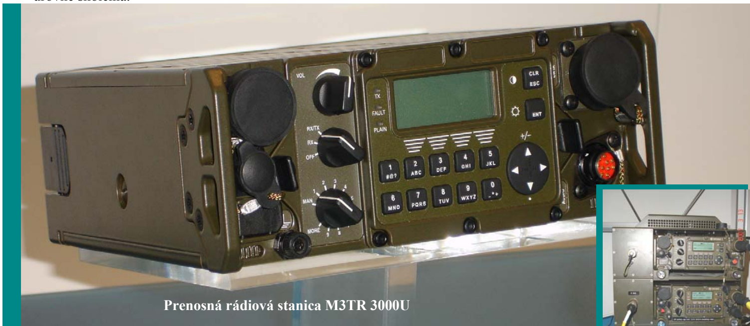
Prenosná rádiová stanica M3TR 3000U