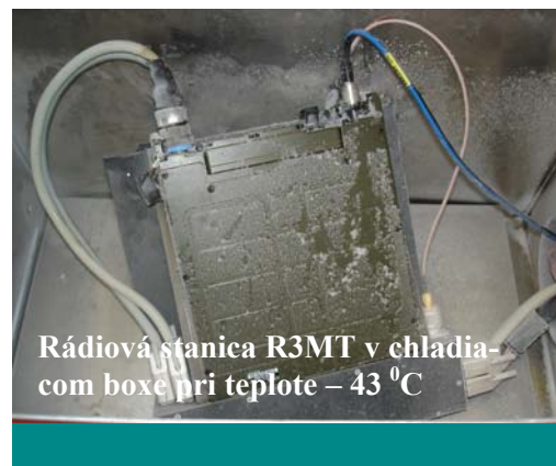
Rádiová stanica R3MT v chladiacom boxe pri teplote -43^{\circ}\text{C}

Záverom by sme mohli skonštatovať, že účasťou na rokovaní sme získali najnovšie informácie o rádiokomunikačných technológiách firmy Rohde & Schwarz i požiadavkách na vzdelanie budúcich používateľov. Návšteva okrem oficiálnych dohôd vytvorila podmienky na rozvoj spolupráce medzi AOS a firmami BAE, Rohde & Schwarz, Delta- B, Corinex, atď. v oblasti prípravy odborných a výcvikových manuálov na podporu implementácie, príprave programov na odbornú a vysokoškolskú prípravu špecialistov, účasť na kontrolných a vojenských skúškach.